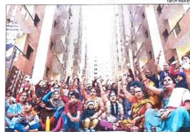
Several BJP functionaries were present during slum dwellers' visit to the Kalkaji EWS flats, recently handed over to the beneficiaries by the PM