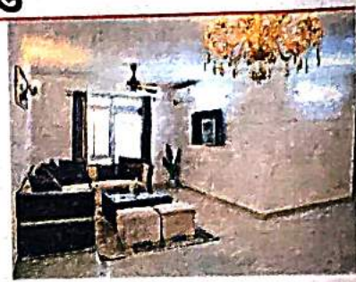
दिल्ली के द्वारका सेक्टर 19 बी में बना डीडीए का प्रीमियम फ्लैट

राज्य खूबो, जागरण • नई दिल्ली: डीडीए की प्रीमियम आवासीय योजना मंगलवार से शुरू हो रही है। आनलाइन बुकिंग 24 सितंबर तक चलेगी। 30 सितंबर को ई-नीलामी की तारीख घोषित की जाएगी। यह योजना दिल्ली के अच्छे और पास इलाकों में बनाए गए रेडी-टू-मूव फ्लैट्स के लिए है।