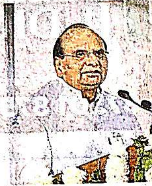
Delhi L-G and DDA Chairperson V.K. Saxena. FILE PHOTO

"Experience during the last two decades has shown that freehold and perpetual lease models were not achieving the desired results due to the high cost of land. This move aims to make available suitable and viable land parcels to different sectors, including warehousing, health, and retail, fostering economic growth and enhancing Delhi's infrastructure," the DDA said.